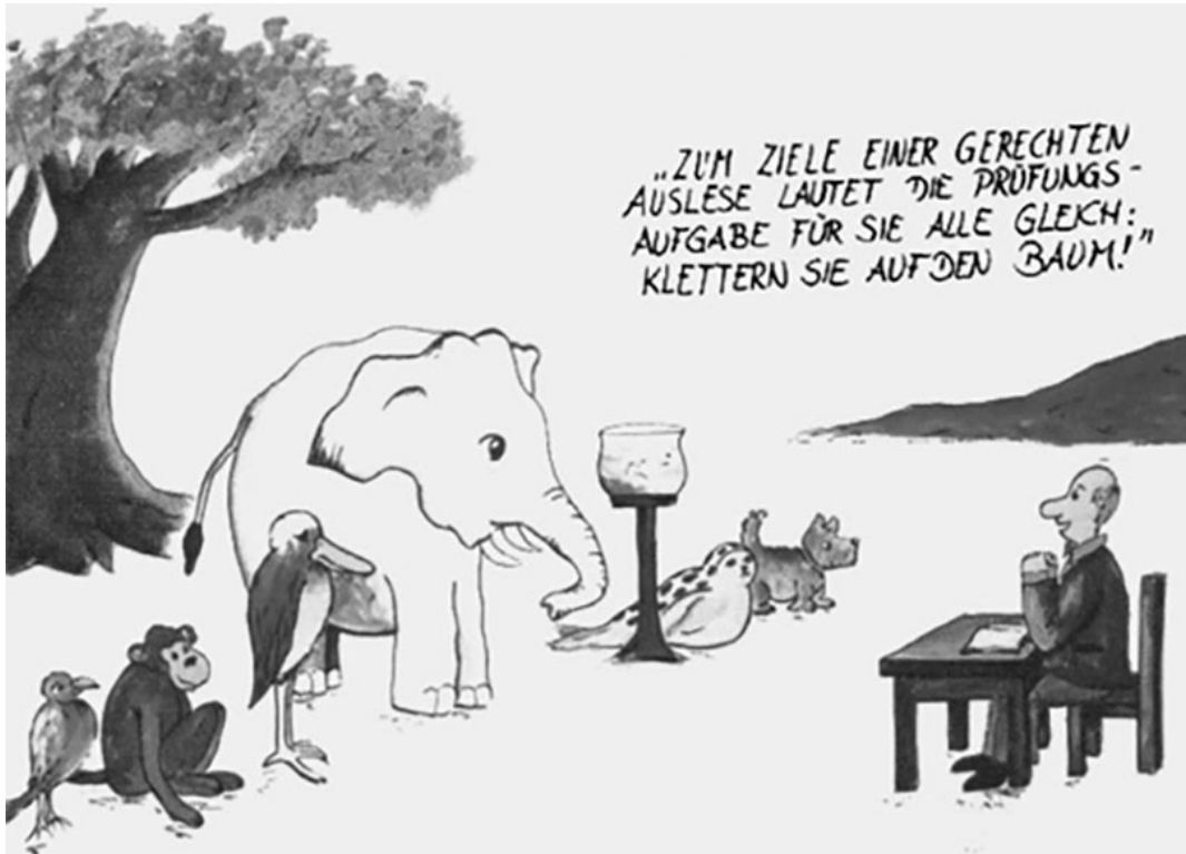
Karikatur von Hans Traxler, aus: Klant, Michael 1983, S.25: Schulpott: Karikaturen aus 2500 Jahren Pädagogik.

2) Beschreibt mündlich die abgebildete Karikatur. Welche Tiere seht ihr? Was fällt Euch auf?